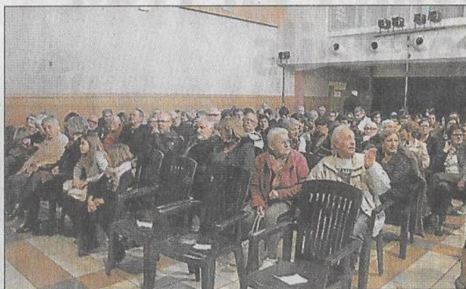
► Le public attend le début du spectacle.