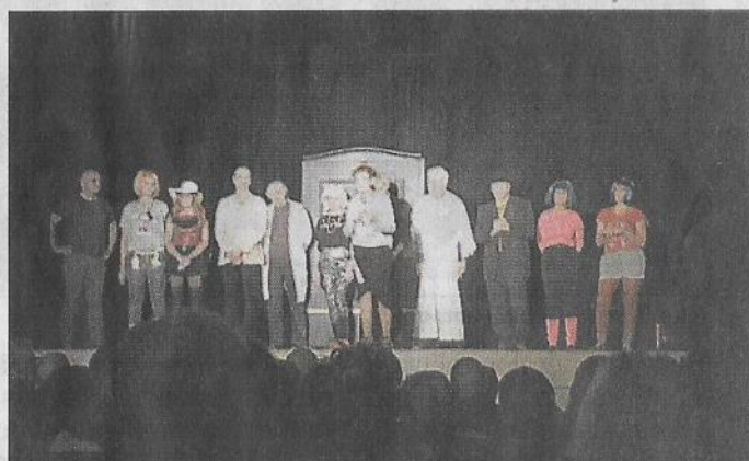
► La troupe des comédiens amateurs sur scène.