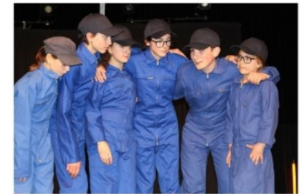
Intrigue Satirique et Sociale

Tout semble bien organisé à Alpha 438. Les habitants y sont heureux et pacifiques. Grâce au "Grand tout". Chacun connaît sa tâche et la fait sans se poser de questions. Tout fonctionne parfaitement dans ce nouveau monde jusqu'à ce qu'un rouage du système commence à réfléchir par lui-même.. Une satire sociale d'un autre monde, pas si loin du nôtre