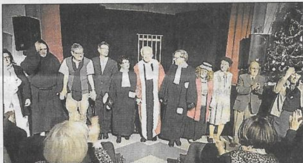
Des comédiens de talent.

L'association Roquefort rencontre invitait tous les amateurs de théâtre à la pièce Zoo jouée par la troupe des Tréteaux Errants de Peyriac-de-Mer. Cette pièce est une adaptation du roman de Vercors des Animaux dénaturés. Bien que comédie, elle traite d'un sujet très sérieux qui pose la question de savoir où se trouve la frontière entre l'homme et l'animal. Ce sujet est traité avec humour et beaucoup de subtilité, ce ne sont pas les grands éclats de rire mais des sourires et des expressions de visages du public qui acquiesce ou désapprouve les débats dans ce plaidoyer puisqu'il s'agit en fait du procès d'un assassin philanthrope. Voilà deux ans que la troupe joue cette pièce dans toute la région avec un succès bien mérité,