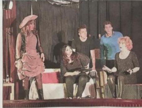
Les comédiens de la Cie Clair Obscur ont ravi le public samedi soir.