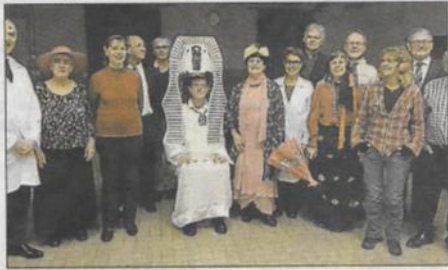
Les acteurs bénévoles.

La troupe des Tréteaux Errants a le plaisir de vous présenter leur dernière création « La Parabole » écrite et mise en scène par l'association. Récit : Sous la conduite du Professeur Eisseim, une équipe de « neurobioticiens » a mis au point une parabole « biomoléculaire vivante ». Elle est construite sur le modèle du cerveau humain, mais en mille fois plus puissant. Connectés à cette parabole, nous acquérons alors, en un clin d'œil, la connaissance de n'importe langue étrangère. Lors d'une séance de tests, le professeur Eisseim, grâce