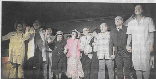
La formidable troupe des Tréteaux Errants.

Dimanche 14 janvier, l'association Les Amis d'enfance invitait les Ribautois à la représentation de la comédie de Vercors « Zoo ou l'assassin philanthrope » par la troupe des Tréteaux Errants de Peyriac-de-mer. Ces derniers, privés d'un rôle principal terrassé par la grippe, ne se démontèrent pas et décidèrent avec leur humour, leur amour du théâtre et leur respect pour le public, de présenter la pièce de Jules Romain « Knock » dont ils ont l'habitude. Le public, venu en nombre et tout disposé à passer un agréable moment, ne fut surtout pas déçu par ce « coup de théâtre » et applaudit à tout rompre la talentueuse troupe, souhaitant vivement toutefois la prochaine programmation de « Zoo ». Comme à l'accoutumée, le spectacle fut suivi d'un pot de l'amitié offert par les membres de l'association.